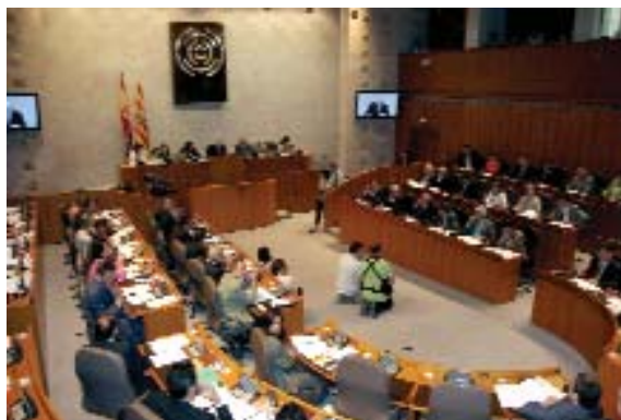
Pleno de las Cortes de Aragón en el que se aprobó la propuesta de reforma estatutaria.

El artículo 85, dentro de este mismo Título, viene a regular los principios y relaciones entre la Comunidad Autónoma de Aragón y los Entes Locales; concretamente, señala que la actividad de las Entidades Territoriales aragonesas se desarrollará bajo los princi-