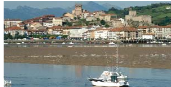
San Vicente de la Barquera (Cantabria)

La FEMP, a través de la Comisión de Turismo de la FEMP, y la Secretaría de Estado de Turismo están negociando los protocolos de desarrollo del convenio en los que se contemplan actividades concretas a realizar y la correspondiente dotación económica para su financiación ★