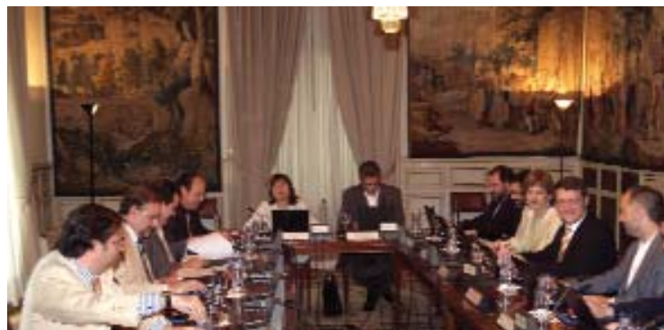
Reunión del Pacto celebrada el pasado mes de julio en la sede del MAP.

Los representantes de las áreas municipales de los partidos políticos firmantes del Pacto Antitransfuguismo acordaron endurecer las condiciones para la presentación de Mociones de Censura en los Ayuntamientos españoles, durante la última reunión en la Comisión de Seguimiento de dicho Pacto, celebrada el pasado mes de julio, en la sede del Ministerio de Administraciones Públicas.