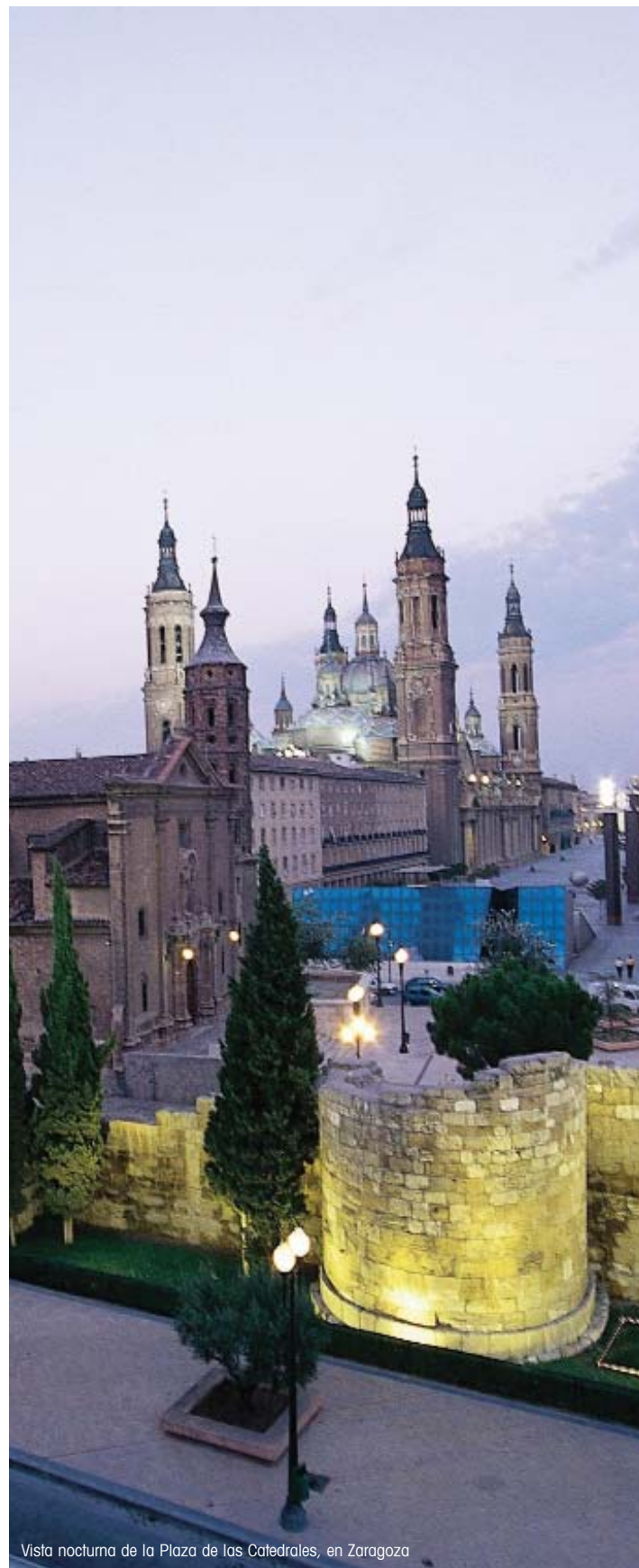
Vista nocturna de la Plaza de las Catedrales, en Zaragoza

Finalmente, la Comunidad Autónoma participará en la financiación de las Corporaciones Locales aragonesas aportando a las mismas las asignaciones que se establezcan por las Cortes de Aragón. El texto especifica que los criterios de distribución de dichas aportaciones deberán tener en cuenta las necesidades de gasto y la capacidad fiscal de los Entes Locales. El conjunto de las aportaciones realizadas a las Corporaciones Locales se integrará en el Fondo Local de Aragón ★