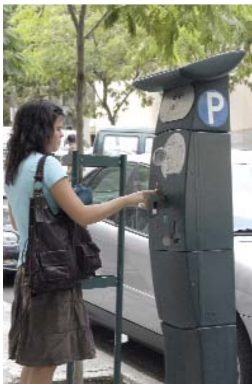
Sistema de aparcamiento regulado de Madrid

En lo relativo a la información y participación ciudadana, la Ley 57/2003, de Reforma del Gobierno Local, prevé el establecimiento de un órgano para la participación de los vecinos y la defensa de sus derechos; además, para garantizar esa defensa, la Ley contempla la creación de una Comisión de Sugerencias y Reclamaciones, de carácter especial, que ha de estar formada por miembros del Pleno, con participación de todos los grupos políticos. La puesta en marcha de esta Comisión es preceptiva en los municipios de gran