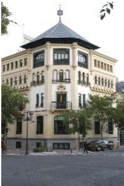
Sede del Defensor del Pueblo, en Madrid.

En cuanto a la resolución de las mismas, a final del pasado año se habían registrado 37.375, (26.693 fueron admitidas a trámite y 10.682 no lo fueron). Las 2.375 restantes estaban pendientes el 31 de diciembre de 2005 ★