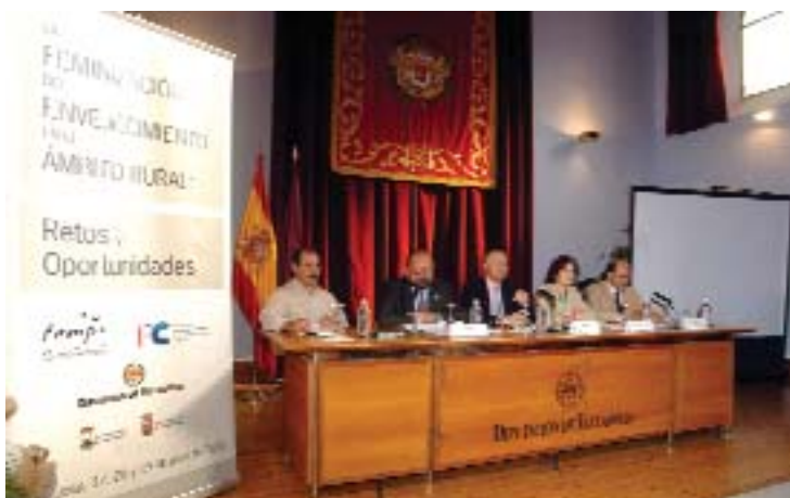
Apertura de la Jornada celebrada en Valladolid.