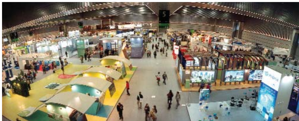
Panorámica de la anterior edición de PROMA, celebrada en 2004.

Aguas Residuales, que se desarrollará en la mañana del 5 de octubre. Según destacan los expertos, este tipo de tecnologías no convencionales permiten a las Entidades Locales españolas, especialmente a las más pequeñas, modernizar sus sistemas de tratamiento de aguas residuales y reducir tanto los impactos ambientales como los costes económicos de estas actividades. Por ello, en el Seminario se presentarán los últimos avances realizados en la elaboración del Plan Nacional de Saneamiento y Depuración de Aguas Residuales y se analizará el estado de las citadas tecnologías y su implantación en España.