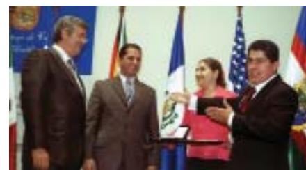
El Presidente de la FCM -a la derecha- entrega al Secretario General de la FEMP una medalla de reconocimiento.

gobiernos locales de América Latina y el Caribe, así como promover el papel que juegan las ciudades en el desarrollo de los países de la región.