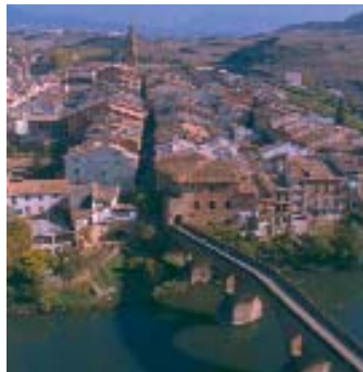
Puente la Reina (Navarra)

El convenio también prevé la creación y la promoción de las redes de municipios referidas al turismo.