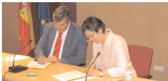
Firma del convenio FEMP-INJUVE, el pasado mes de julio 2006

En la actualidad está vigente además, el convenio marco que ambas entidades firmaron en febrero de este año, con una dotación económica de 969.550 euros, para actuaciones que promuevan la convivencia e integración social, la emancipación de los jóvenes, su participación en asociaciones y la creación de espacios e infraestructuras para este colectivo ★